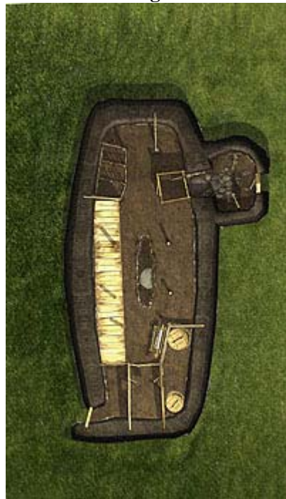
Grunnmynd af skálanum í Aðalstræti